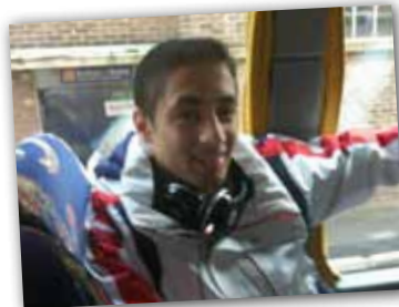
En route pour le programme court !