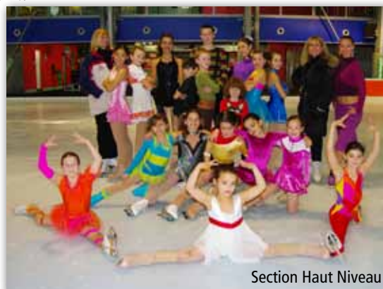
Section Haut Niveau