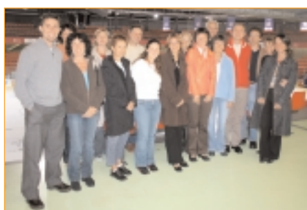
◀ Une partie des membres du nouveau conseil d'administration.

Le nouveau nom du club, Grenoble Isère Métropole Patinage (G.I.M.P) et son logo, que vous connaissez depuis deux ans maintenant, ont été approuvés lors de cette assemblée.